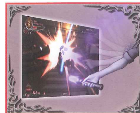
コントローラーを振って攻撃します。

新開発のムチ型コントローラーを振って遊ぶことでバンパイアハンターを体感できます。また、これまでのドラキュラシリーズ同様、「サブウエポン」もコントローラーについたボタンを使って操作できます。