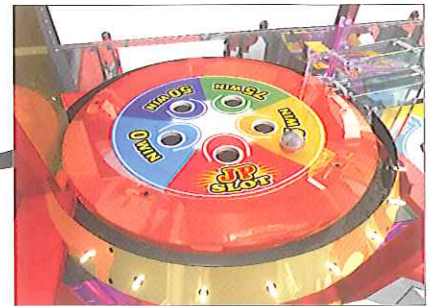
スピンフィールド