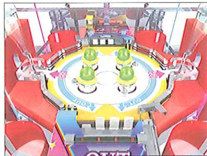
センターフィールド

どこまでメダルが獲得できるのか期待が膨らむ継続型ボーナスゲームを採用。抽選フィールドからボールがなくなるまでメダル獲得のチャンス! チャンスの連続が今まで感じたことのない面白さを実現しました。