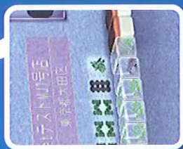
見えている牌から 相手の手の内を予測しよう!