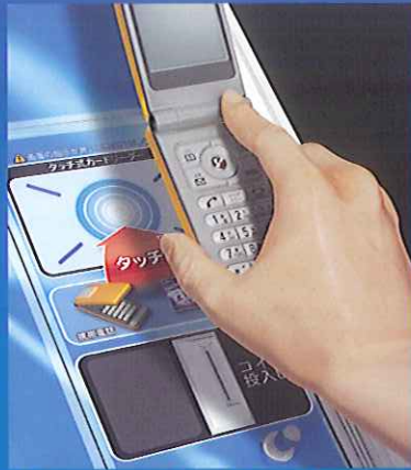
電子マネー対応の携帯電話が使えます。

※カードシステム変更に伴い、MJメンバーズカードは使用回数に限度がなくなりました。 ※戦績・段位等の閲覧やキャラクターカスタマイズ等、MJメンバーズカードと同じサービスが 携帯電話で利用できます。電子マネー機能には対応していません。