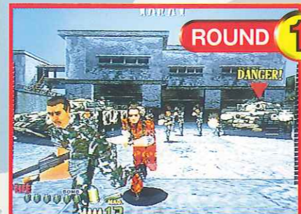
ROUND 1 敵兵器工場/牢獄からの脱走 Arms factory: To run away from prison