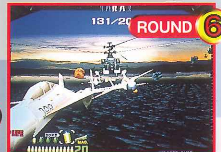
ROUND 6 脱出用ヘリ内部/敵国より脱出 Inside the helicopter for the escape: To escape from the hostile land