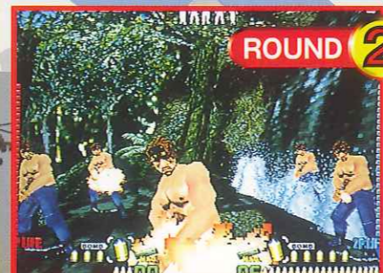
ROUND 2 密林地帯/敵のアジトへ向かう Jungle: To go to enemy's headquarter