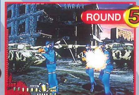
ROUND 5 廃墟/脱出経路の確保 Ruin: To ensure the escaping route