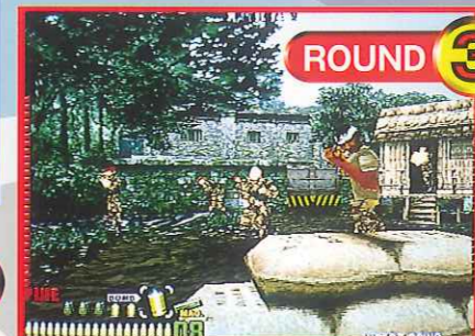
ROUND 3 ゲリラのアジト/仲間を救出 Enemy headquarters: To rescue the prisoners