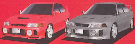
MITSUBISHI LANCER GSR Evo.IV MITSUBISHI LANCER GSR Evo.V