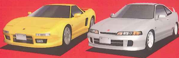
HONDA NSX Type S-zero HONDA INTEGRA Type-R