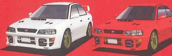
SUBARU IMPREZA WRX STI Version V SUBARU IMPREZA TypeR STI Version V