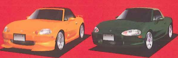
MAZDA ROADSTER A-spec 1.8 MAZDA ROADSTER 1.6