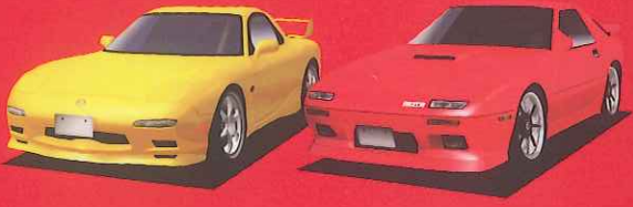
MAZDA RX-7 Type-RZ SAVANNA RX-7 ∞