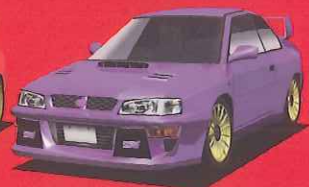
SUBARU IMPREZA 22B STI