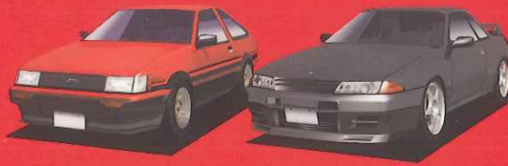
TOYOTA LEVIN GTV NISSAN SKYLINE GT-R