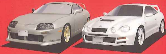
TOYOTA SUPRA RZ TOYOTA CELICA GT-FOUR