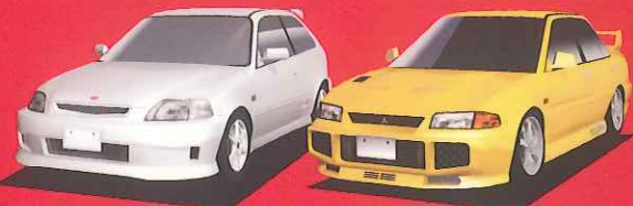
HONDA CIVIC Type-R MITSUBISHI LANCER GSR Evo.III