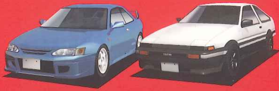
TOYOTA LEVIN BZ-R TOYOTA TRUENO GT-Apex