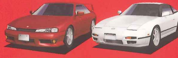
NISSAN SILVIA K'S NISSAN 180SX Type-x