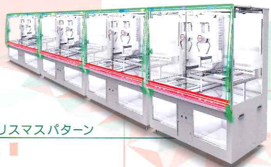
クリスマスパターン