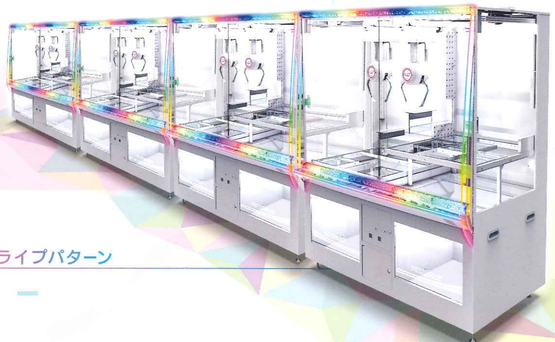
ストライプパターン