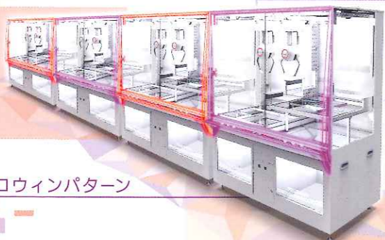
ハロウィンパターン