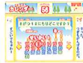
てちてちレジャー