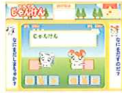
てちてちじゃんけん