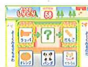
まんながしりとり