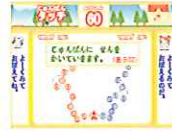
しょうげにけけるかな?