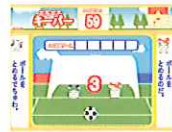
じゃんぱんタッチ