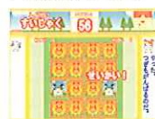
しんけいさいじやく