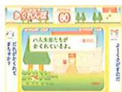
どこかな? かくれんぼ