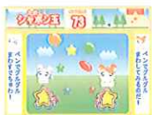
たのしくしゃボン玉