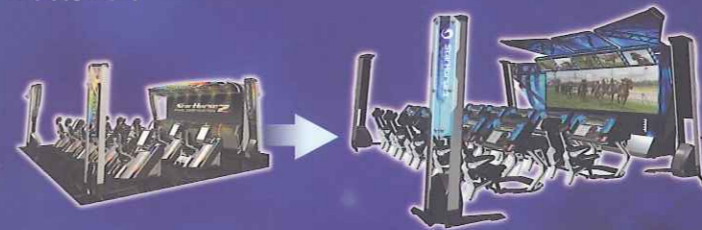
StarHorse2 FINAL DESTINATION CVT更新のため 去年〜昨年データのデータでした。

スターホース3では、実際のレース結果をもとに、馬の強さや、今後の活躍への期待度など、最新データを翌月に配信。現在活躍中の強豪馬とプレイヤーが自家生産した馬を、いち早く競わせることが可能に。リアルレースとの連動により、まさに「最新世代配信」が実現します!