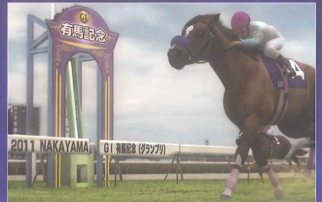
StarHorse3 Season1 A NEW LEGEND BEGINS ネット配信で最新レース結果を 翌月配信!!