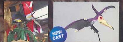
Image is more powerful! PTERANODON is now in additional. Two of preferred PTERANODON are additionally installed in center of the cabinet. DINO world is newly effected.

強化特徵, 追加新型恐龍。 遊戲中, 用翼飛支持2只新增加的飛龍, 展現新穎恐龍世界。