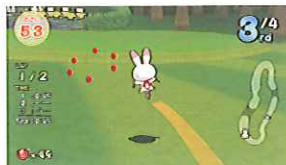
■ハッピージュエル：コースに落ちているジュエルを取るとスピードアップ!

「ホッピングロード」はアミューズメント・アイランドの4つのレジャーエリアに造られたコースを舞台に、ホッピングに乗った動物たちが元気にびよんびよん跳ねながら競走するレースゲームです。