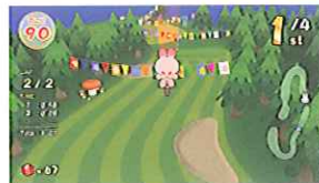
■スーパーホップ：大ジャンプで一発逆転!ライバルに差をつける!