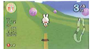
■ハテナアイテム：アイテムを取るとジュエルを大量ゲットできるチャンス!