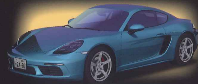
718 Cayman S