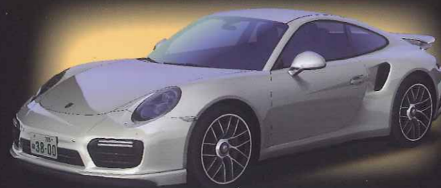
911(991) Turbo S