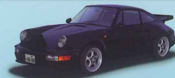
911(964) Turbo 3.6