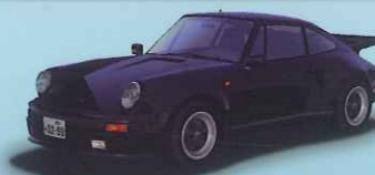
911(930) Turbo S

原作「湾岸MIDNIGHT」の メインライバル「ブラックバード」の ベース車もついに参戦!