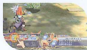
スキル 使いたいスキルをタッチしボタンで発動!