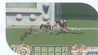
特殊行動 Attack+Forceボタンの同時押しで特殊行動!