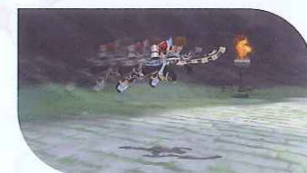
空中特殊行動 ジャンプ中にAttack+Forceボタンの同時押しで空中特殊行動!