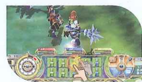
アイテム使用 アイテムをダブルタッチか選択状態でUSEボタン!