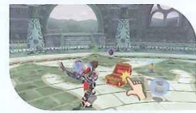
アイテムGET ゲーム中に拾えるアイテムや宝箱をタッチしてゲット!