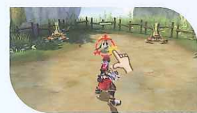
ロックオン 攻撃する対象を特定したい時にタッチ!