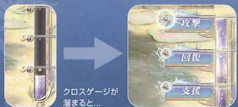
クロスゲージが 溜まると...

ボス戦での切り札となる仲間同士の 「合体攻撃」、それがクロスゲージ! クロスゲージを最大まで溜め、 仲間同士タイミングを合わせて ボタンを押すことで発動します。