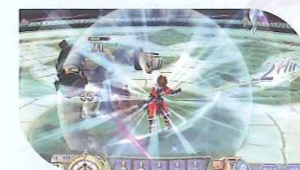
緊急回避攻撃 Jump+Attack+Forceボタンの同時押しでピンチから脱出!

イヤホンジャック | イヤホンジャックにはヘッドホンなどを接続でき、さらに深く「クロス」の世界へ集中できます。