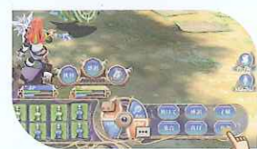
チャット アイコンをタッチして他のプレイヤーと会話!