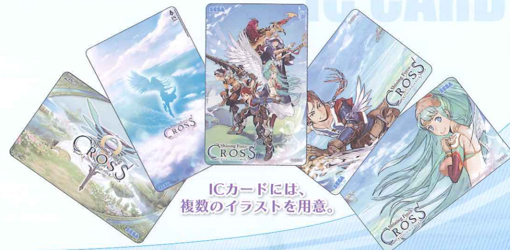
ICカードには、複数のイラストを用意。