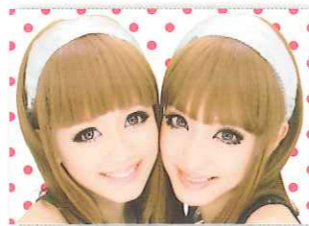
◎ UP image (yoko & tate)

シルバー×レインボーに光るイルミネーションのカメラカバーと、フヤフヤで丸いフォルムの傘ストロポが近未来なオシャレ感を演出した内装。正面配置の17インチタッチパネルは操作性抜群でより快適に。またタッチ不要のライトアップ機能搭載でアップに強く盛れそうな予感がうれしい。極めつけは「こんな風にとれたよ」というライブビュー画像のキレイさから得られる期待感。