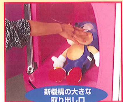
新機構の大きな取り出し口