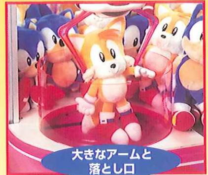
大きなアームと落とし口